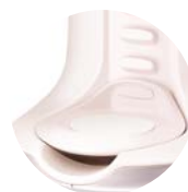
PLATEAU SUPPORT BIBERON RÉGLABLE