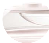
RÉSERVOIR D'EAU AMOVIBLE